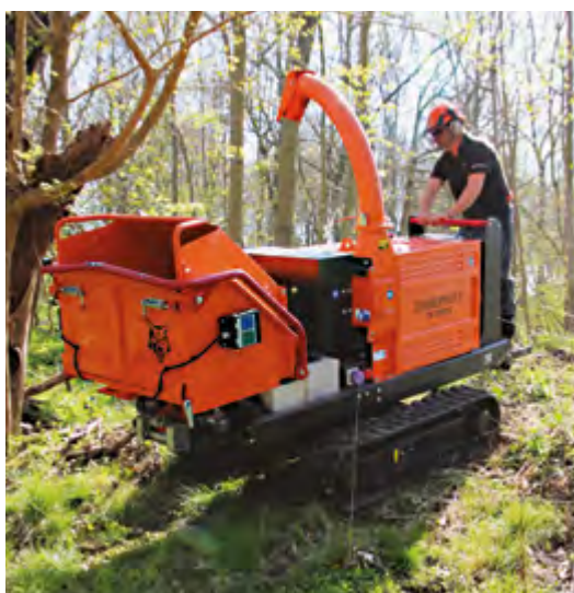
TW 230 VTR