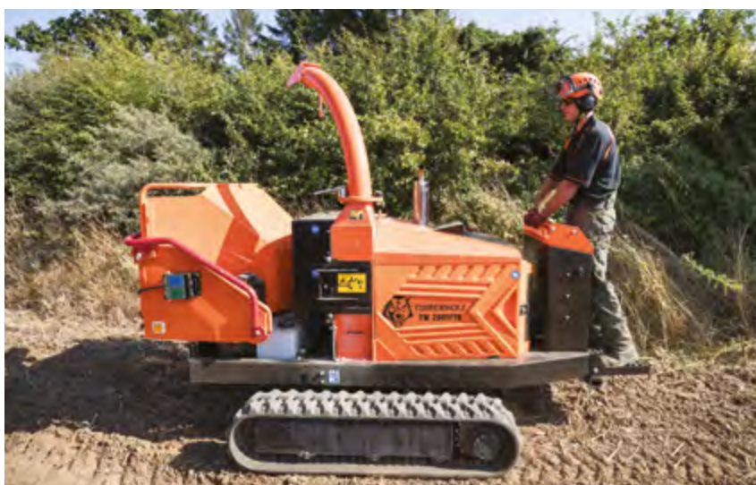
TW 280 TFTR