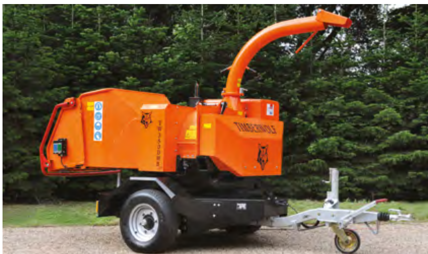
TW 350 DHB(T)