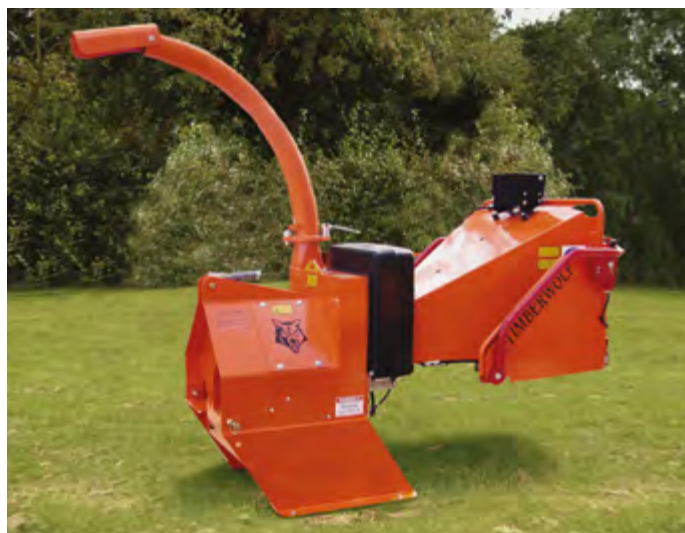
TW PTO/150 H