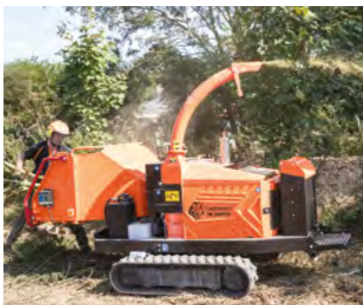
TW 280 TFTR