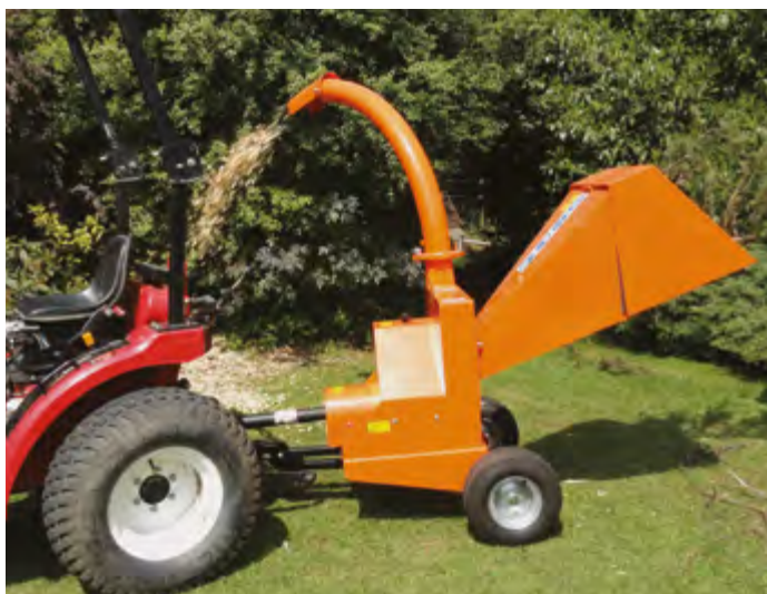
TW PTO/100 G