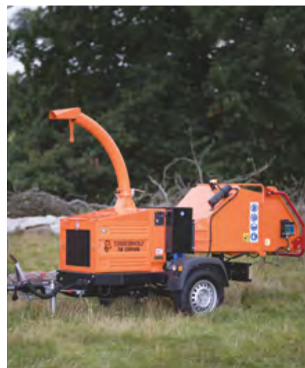
TW 230 PAHB