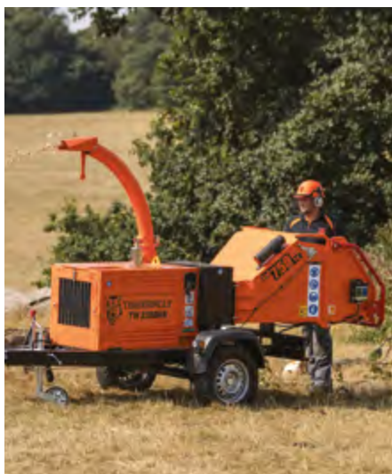
TW 230 DHB