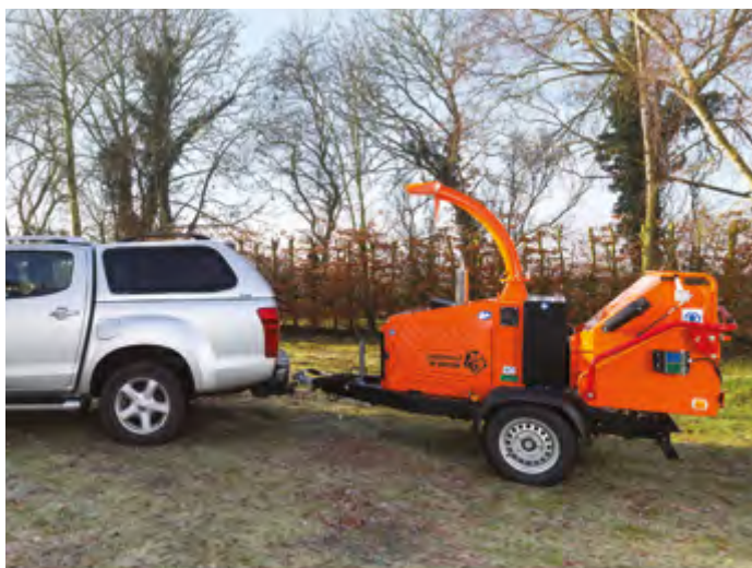
TW 280 TDHB