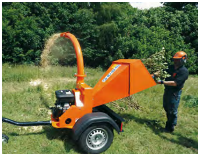
TW 18/100 G