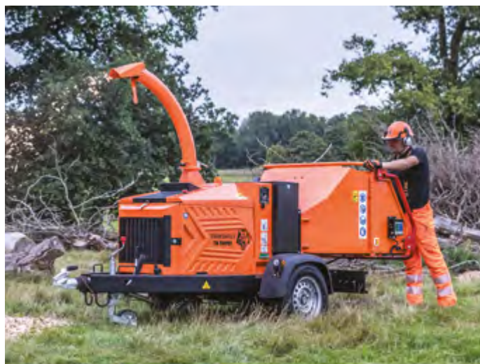
TW 280 PHB