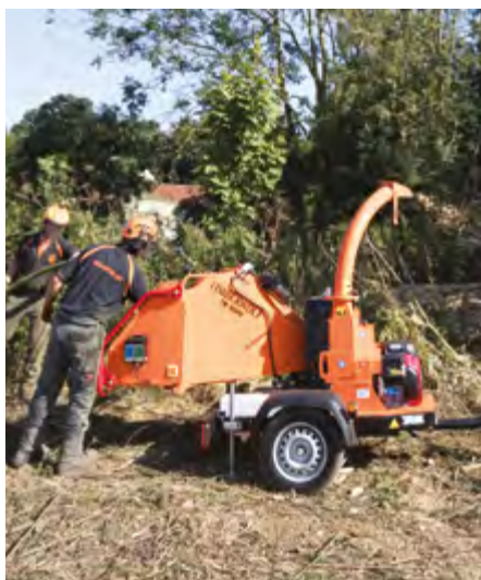
TW 160 PH